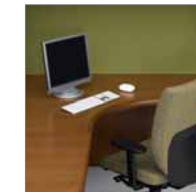
CURVED CORNER MODULE DE COIN ARRONDI