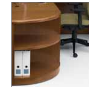
DESK HEIGHT CORNER BOOKCASE BIBLIOTHÈQUE DE COIN À HAUTEUR DE BUREAU